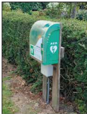
+ Op veel plaatsen is er snelle beschikking over een AED in Scharendijke.

De eerste zes minuten zijn in dat opzicht van cruciaal belang" aldus Schoemaker. De reanimatiecursussen werden in de afgelopen jaren druk bezocht. Mede dankzij